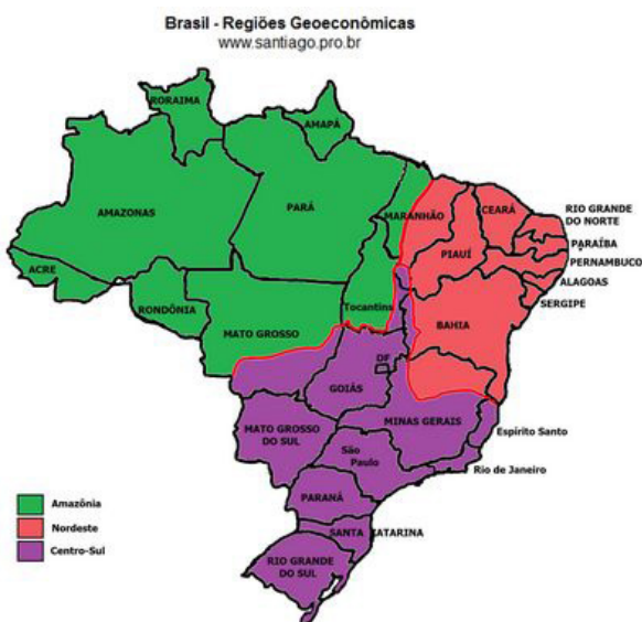
Elaborado por: Santiago Alves de Siqueira - www.santiago.pro.br http://www.geografia.seed.pr.gov.br/modules/galeria/uploads/5/normal_brasilgeoeconomico.jpg

Os limites da Amazônia correspondem à área de cobertura original da Floresta Amazônica. Essa região é caracterizada pelo baixo índice de ocupação humana e pelo extrativismo vegetal e mineral.