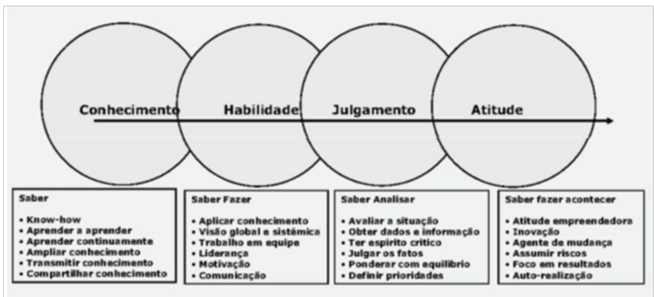
Figura – As competências essenciais do administrador, segundo Chiavenato

Assim, o administrador deve ocupar diversas posições estratégicas nas organizações e desenvolver papéis essenciais à sustentabilidade e crescimento dos negócios.